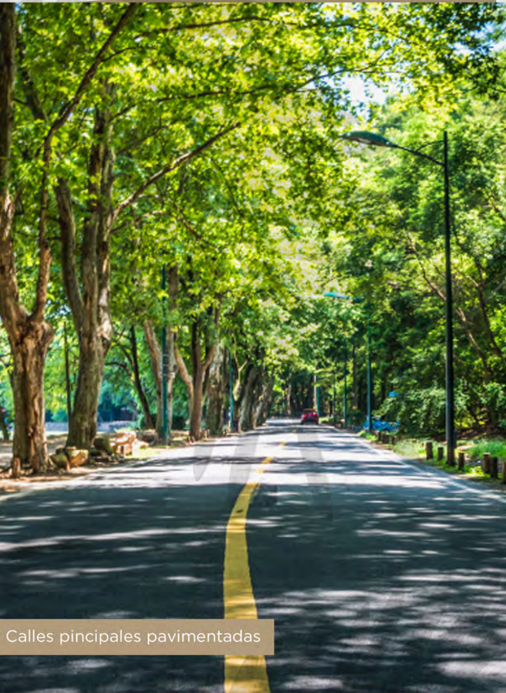
Calles principales pavimentadas